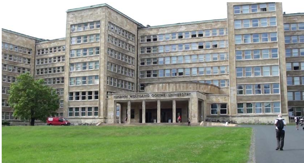
Montag, 12. Mai Besuch auf dem Campus Westend, dem zweiten Campus der Goethe-Universität, wo die Geistes- und Gesellschaftswissenschaften beheimatet sind.